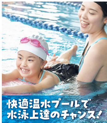
快適温水プールで 水泳上達のチャンス!